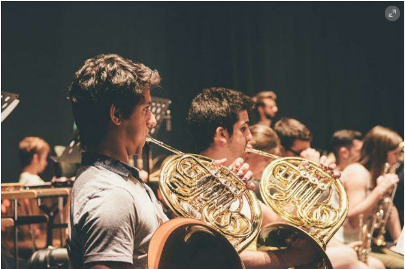
La sezione dei corni della GMJO al Teatro Verdi di Pordenone durante le prove del tour estivo 2017

«Penso che la sola vera differenza sia che un'orchestra di professionisti ha maggiore esperienza. Ma la Gustav Mahler è come un'orchestra professionista, con il vantaggio che i giovani hanno ancora energia positiva e non sono già irrigiditi in un modo di pensare o di suonare. C'è qui un entusiasmo difficilmente riscontrabile altrove. I giovani sono più morbidi, cercano opportunità di apertura. E per la musica questo è un bene: perché non puoi irrigidire la musica, è qualcosa di fluido. Devi restare aperto a cosa accade».