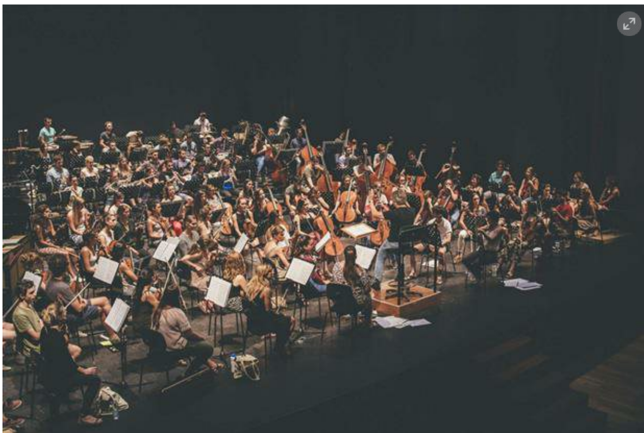
Ingo Metzmacher al Teatro Verdi di Pordenone prepara con la GMJO il tour estivo 2017

«È molto difficile inquadrarla, anche perché ci sono elementi tecnici molto complessi. Il titolo Turangalîla è composto da due termini sanscriti che implicano due elementi, due caratteri, l'amore e il gioco. E questi sono facilmente individuabili, nelle atmosfere, nei temi e nell'aspetto ritmico. Ma il vero problema è rappresentato dalla lunghezza: dieci movimenti per un'ora e 20 minuti di musica... In questa sinfonia c'è dentro l'universo. Stelle, grandi montagne, i canti che gli uccelli intonano da prima ancora che l'uomo apparisse sulla terra. Messiaen ha orizzonti amplissimi. E ama la lentezza. La sua grandezza di pensiero mi cattura. Messiaen è stato un gigante solitario. La sua voce è fortissima. Il suo linguaggio è chiaro, robusto. Radicato nella fede, un fatto insolito per il Novecento. E molti dei suoi pezzi, come la stessa Turangalîla , Éclairs sur l'Au-Delà , La Transfiguration , il Saint François d'Assise hanno misure enormi. Spesso la musica moderna è complicatissima e breve. Messiaen invece ambisce a proporzioni cosmiche. Ed è una cosa che mi affascina. Anche Stockhausen è così: punta il suo sguardo oltre l'orizzonte umano. Sono musiche con dentro la forza delle stelle».