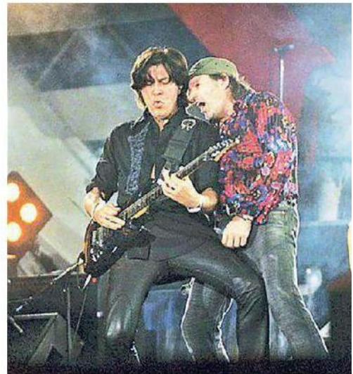
Edoardo Bennato e a destra il chitarrista Maurizio Solieri durante un concerto con Vasco Rossi

La proprietà intellettuale è riconducibile alla fonte specificata in testa alla pagina. Il ritaglio stampa è da intendersi per uso privato